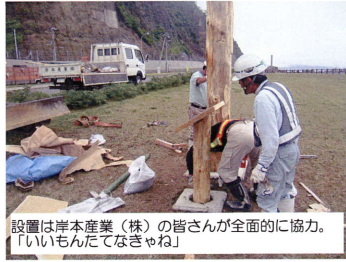
設置は岸本産業(株)の皆さんが全面的に協力。「いいもんたてなきゃね」

7月19日(土)、「にしん街道」標柱除幕式が行われました。 日本海沿岸各地で取り組まれていた「にしん街」プロジェクトが、これまででも大きな差や岩内など各地で標柱が建てられてい